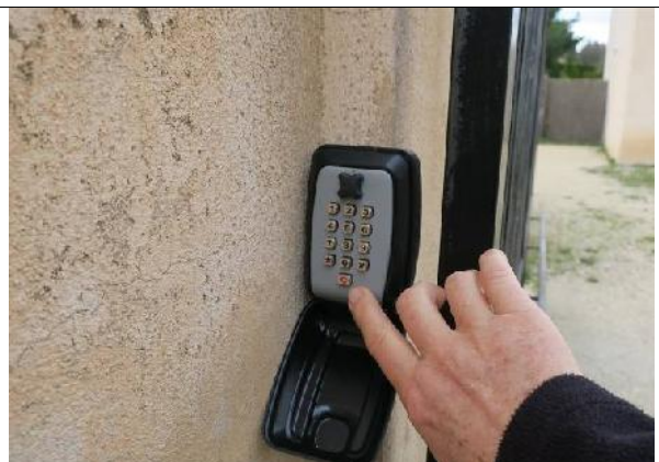
4 Composer le code reçu. Celui-ci commence par la lettre C