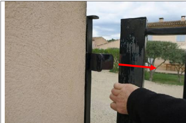
1 Ouvrir le portail en le tirant vers la droite