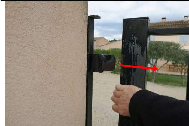
1 Open the gate by pulling it to the right