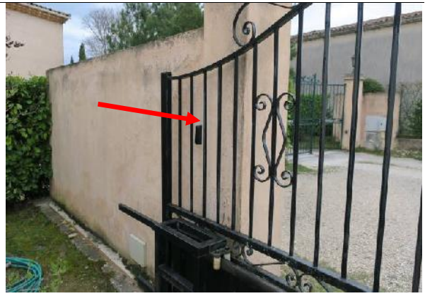
2 La boîte à clef est derrière le portail