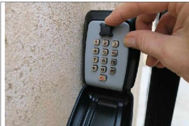
5 Pour ouvrir, tourner la molette dans le sens des aiguilles d'une montre.