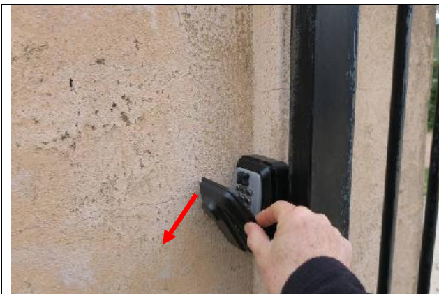
3 Basculer le capot de protection vers le bas